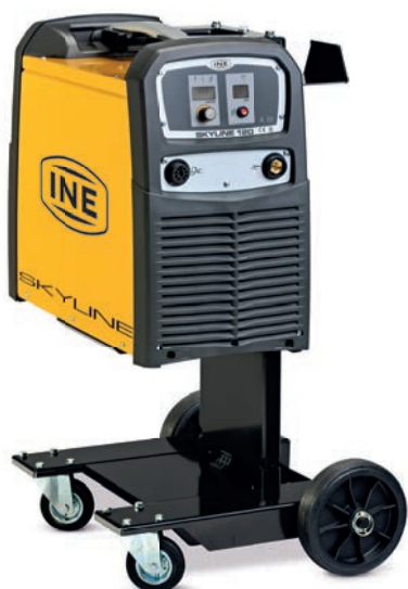
SKYLINE 60/90/120 + PR9