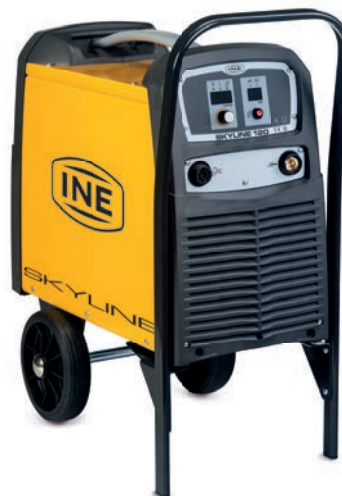
SKYLINE 60/90/120 + KR1